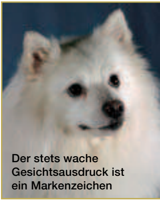
Der stets wache Gesichtsausdruck ist ein Markenzeichen

► Alle Spitze, die deutschen genauso wie die fernöstlichen, sind exzellente Wächter, revidertreu und Fremden gegenüber erst einmal misstrauisch. Und genau diese Eigenschaft unterscheidet sie von ihren nördlichen „Brüdern“, den Nordischen Jagd- und Schlittenhunden, die häufig genug noch wie große, etwas zu lang geratene Spitze aussehen. Aber: