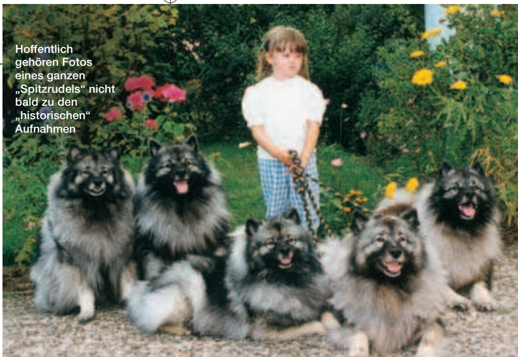
Hoffentlich gehören Fotos eines ganzen „Spitzrudels“ nicht bald zu den „historischen“ Aufnahmen

Nur einmal (1781) machte ein Spitz Schlagzeilen. Der holländische Republikaner de Gyselaer, den man „Kees“ nannte, hatte als ständigen Begleiter und „Markenzeichen“ immer einen Wolfspitz neben sich. Doch die Rebellion des „Kees“ scheiterte, und der „Kees-Hund“ geriet wieder in Vergessenheit. Und als dann 10 Jahre und 50 Jahre später die Menschen in Europa wirklich an den Thronen rüttelten und ihre Bürgerrechte durchsetzten ... da hatten die Bürger hierzulande nichts Wichtigeres zu tun, als es den Adligen – end-