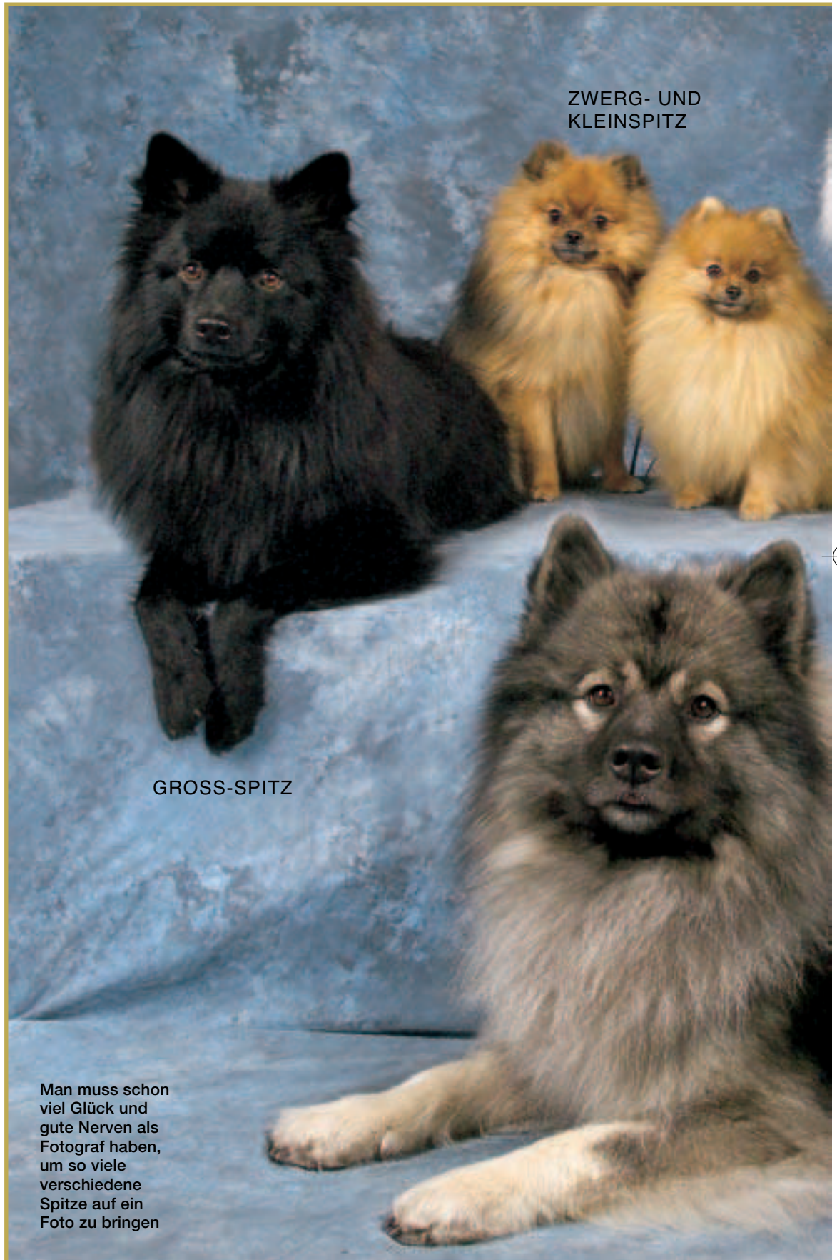
ZWERG- UND KLEINSPITZ

Üblicherweise sagt man, die ältesten Spitze seien jene „Torfhunde“, die man in den 6.000 Jahre alten Pfahlbausiedlungen am Bodensee fand. Aber man fand auch Spitz-ähnliche Hunde in 8.000 Jahre alten Ausgrabungen in Dänemark und England. Und man fand 10.000 Jahre alte Hundegräber in Japan, in denen, sorgsam mit Muscheln bedeckt, kleine, Spitz-ähnliche Hunde bestattet waren. Man fand und findet Spitz-ähnliche Hunde in Skandinavien, Holland, Deutschland, im an-