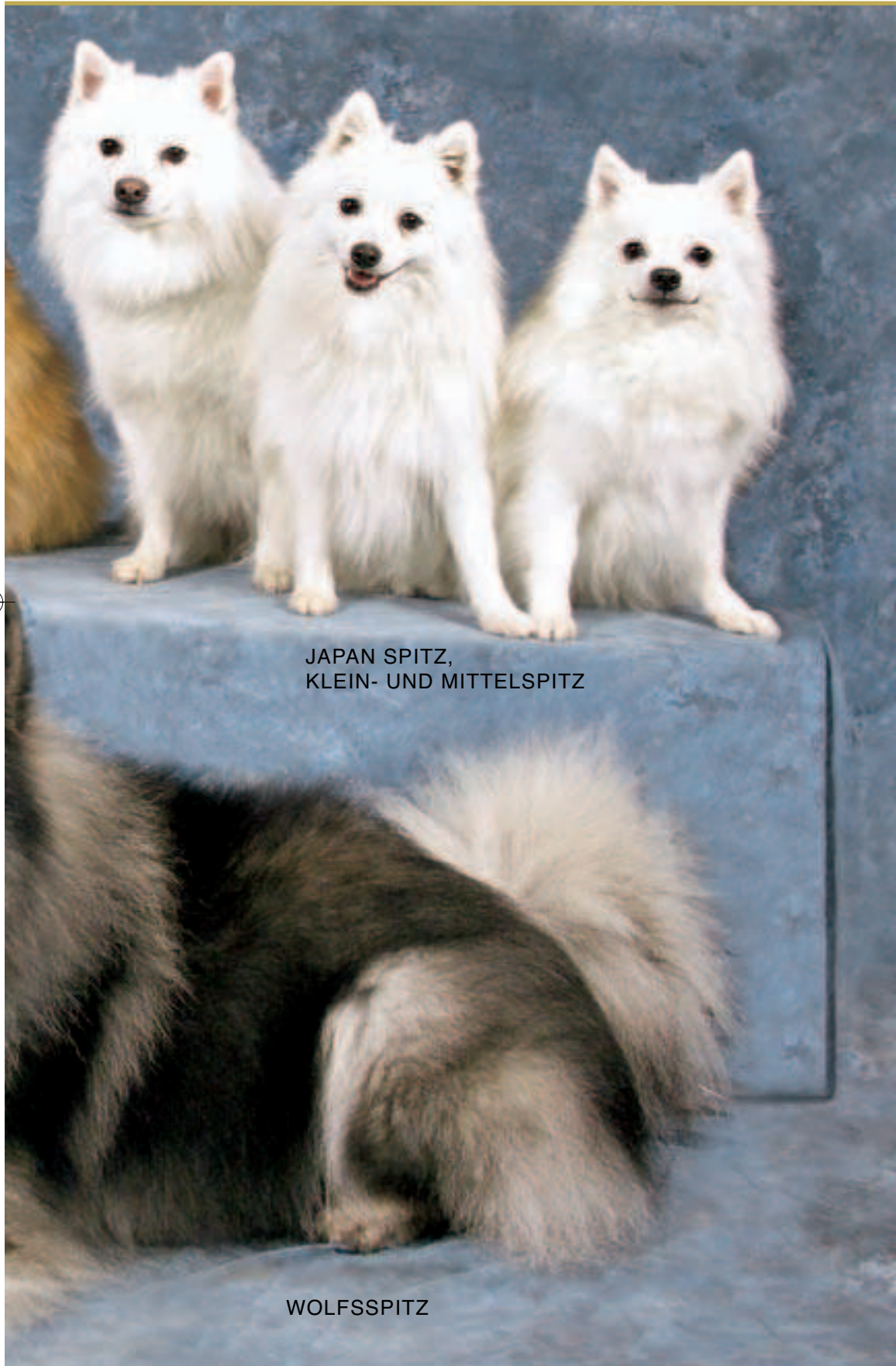
JAPAN SPITZ, KLEIN- UND MITTELSPITZ