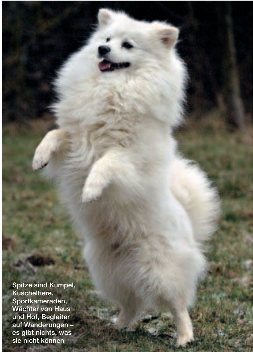
Spitze sind Kumpel, Kuscheltiere, Sportkameraden, Wächter von Haus und Hof, Begleiter auf Wanderungen – es gibt nichts, was sie nicht können