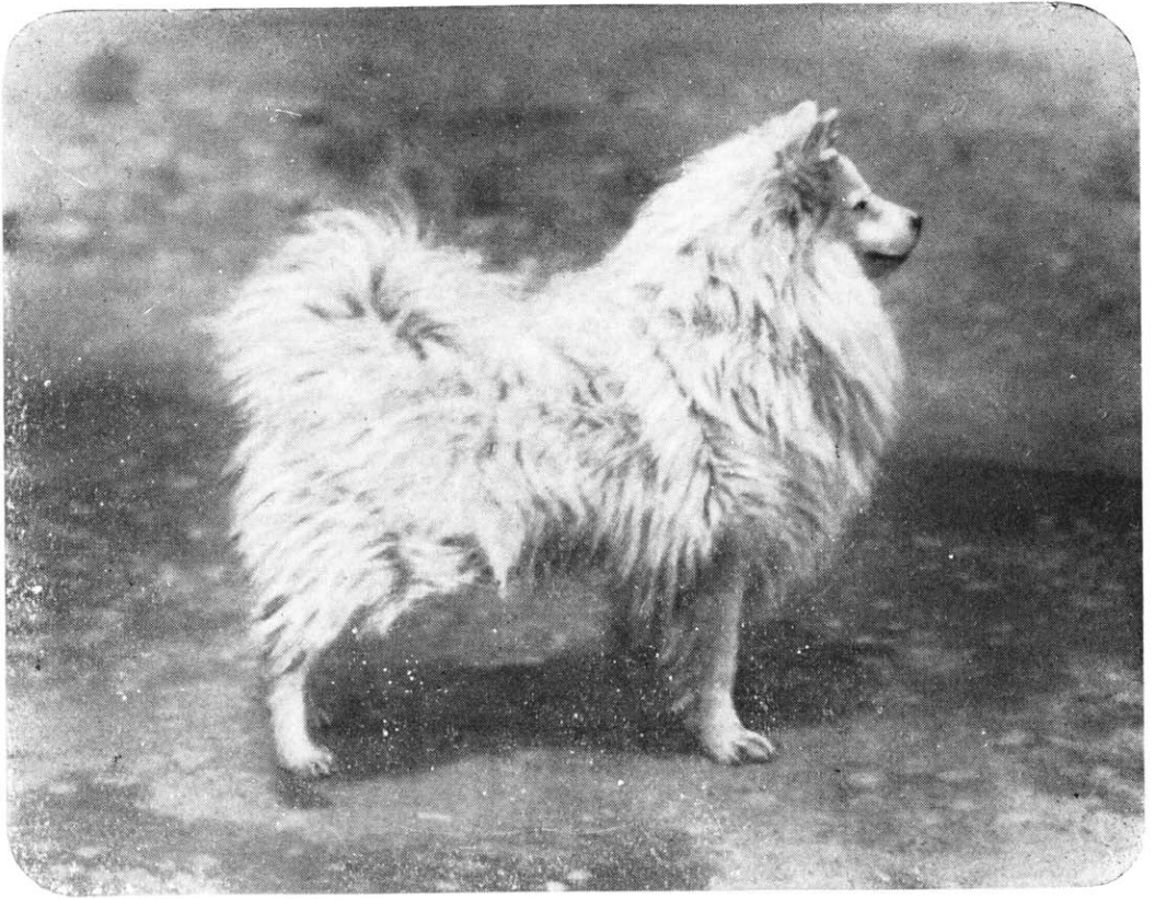
Großer weißer Spitz