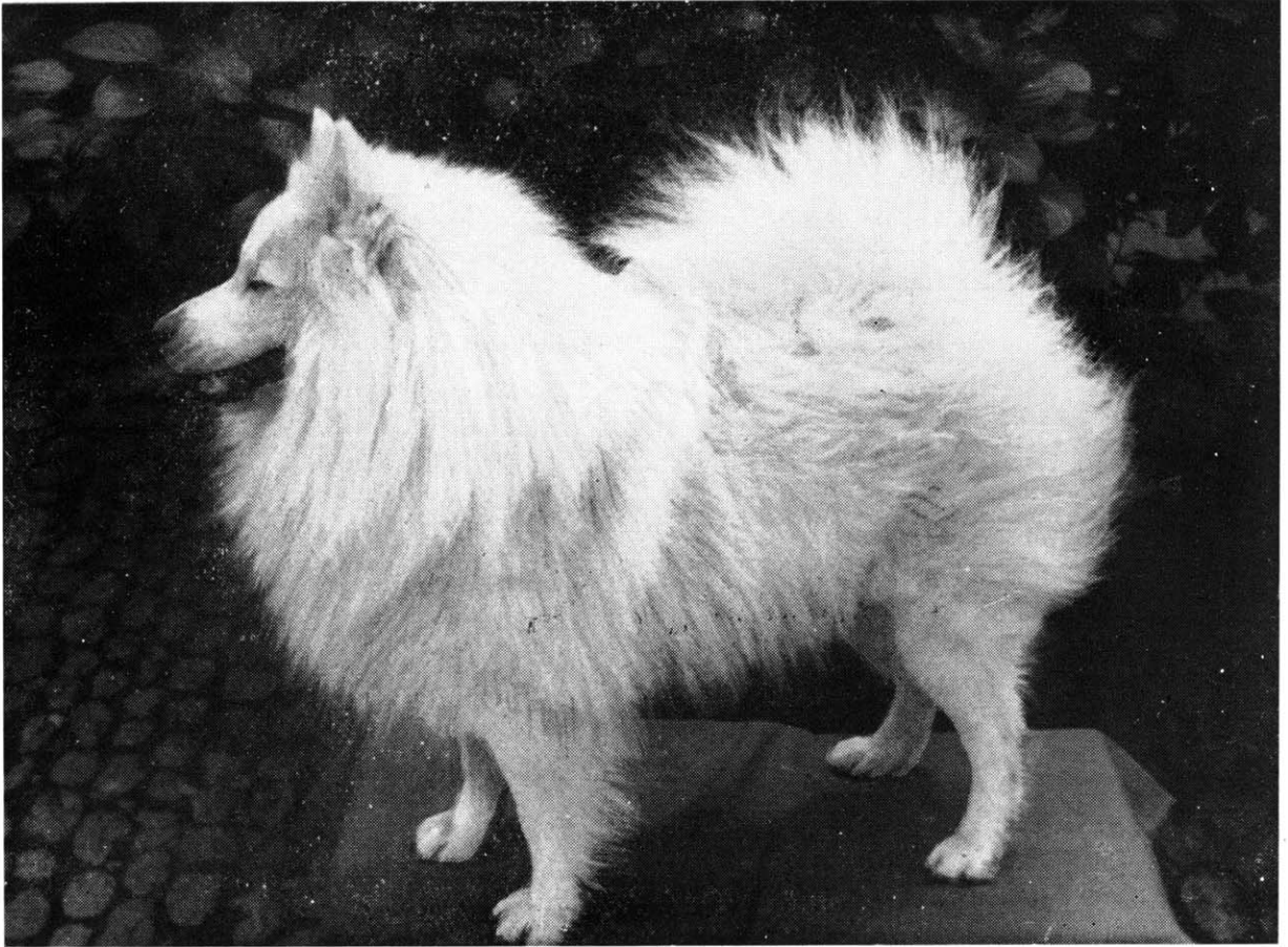
Großer weißer Spitz